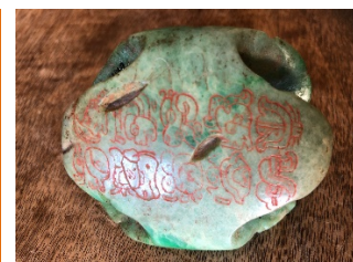
Bijou en carapace de tortue