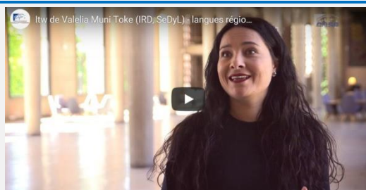
Les langues régionales dans les Outre-mer Valelia Muni Toke