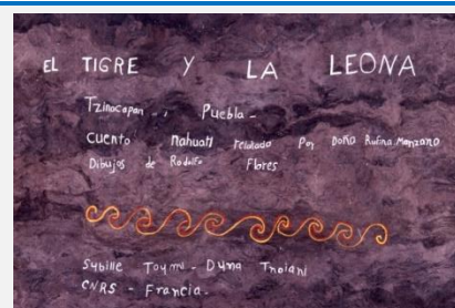
Le tigre et la lionne, conte nahuatl sous-titres en espagnol / en français