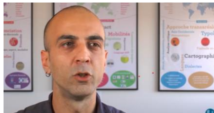
Parlez-vous créole ?