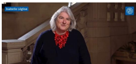
L'autre mondialisation – GRIP